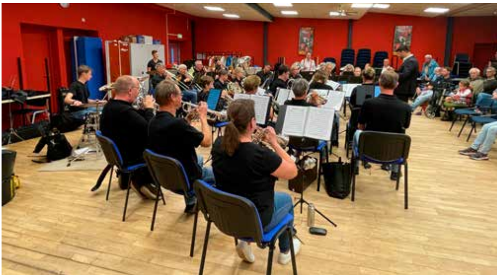
linfano burendag 2023

Het JTC heeft ook al een indrukwekkende staat van dienst, waaronder het winnen van het Gelre Kamermuziekconcours in 2022. Ze hebben opgetreden door heel Nederland, met als recent hoogtepunt hun deelname aan de Slide Factory '24 in Rotterdam. Veel leden van het JTC zijn inmiddels doorgestroomd naar professionele orkesten, wat getuigt van hun hoge niveau en toewijding aan de muziek.