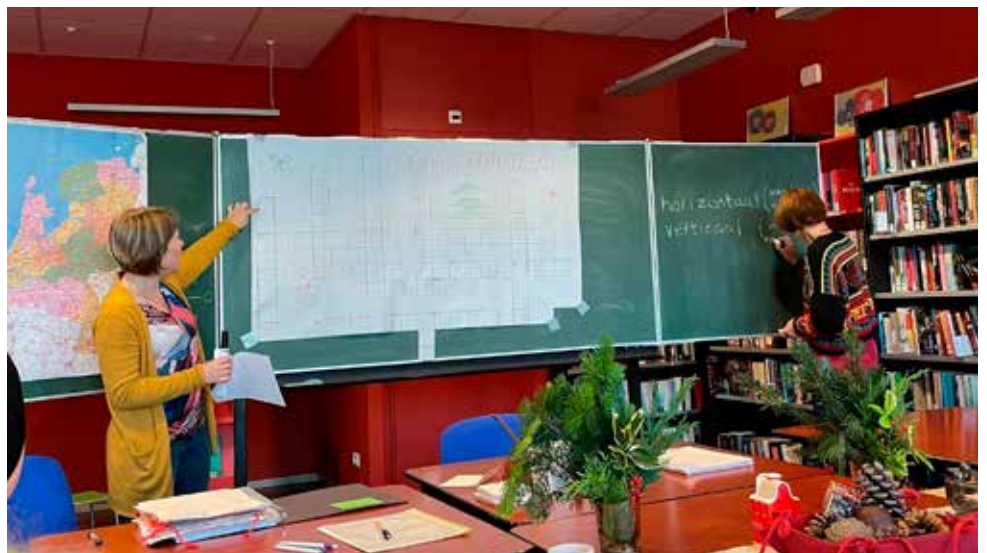
Taalles in De Brede Vaart

De taallessen is maar één van de activiteiten van de Interculturele Contactgroep Linschoten. Om het doel te bereiken: mensen zoveel mogelijk met elkaar in contact brengen, worden er ook koffiemiddagen en picknicks georganiseerd, er worden thuiscontacten onderhouden zoals kraamvisite of condoleren, en er is hulp bij het invullen van formulieren en ondersteuning bij de omgang met instanties. Eén keer in de 5 à 6 weken is er