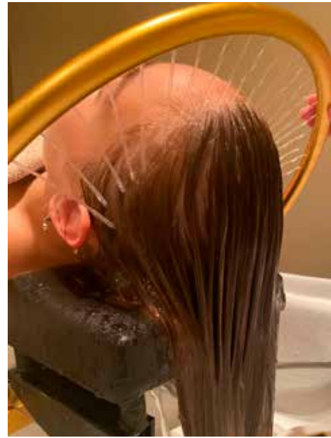
De head spa tool als een watervalletje

Als afsluiting volgt een massage van de nek en schouders. Een behandeling duurt ruim een uur. Daarna föhnen we het haar droog, maar we brengen het niet in model. Dat is ons vak niet."