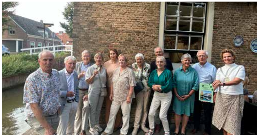
Schansbosburen 50 jaar

En nu, afgelopen augustus, is het tiende burenlustrum gevierd én het feit dat vijf echtparen 50 jaar of langer getrouwd waren. En ook nu, evenals 50 jaar geleden,