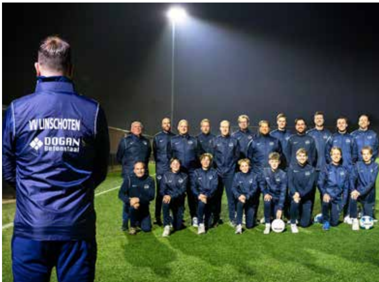
VVL-trainers in nieuwe sponsorkleding.

Het inpassen van ervaren trainers vergt toch een wat andere aanpak en is iets voor de toekomst. Hoe die eruitziet weet Piet nog niet: “Elk jaar zal anders zijn. We zullen dat in de gaten moeten blijven houden, want het gaat nu hartstikke goed met de jeugd van de club. We hebben nu iets opgezet dat laagdrempelig is, dat goed werkt en waarover iedereen enthousiast is. Er is een team- en clubgevoel, de club groeit en bloeit en dat is mooi om te zien.”