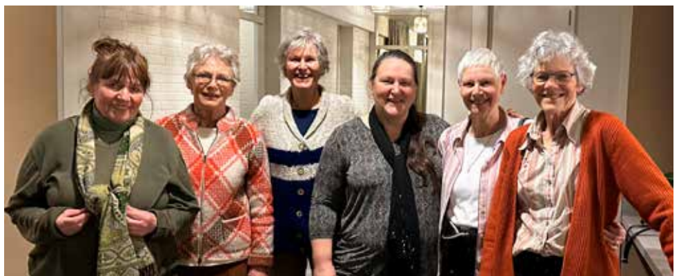
De initiatiefnemers van 'Ontmoeting raakt'