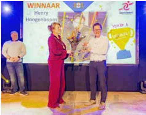
De Award uitreiking

Zijn bestuur van Polsstokclub Linschoten (PCL) droeg hem voor vanwege zijn grote inzet en de enorme hoeveelheid werk die hij al jarenlang voor de vereniging verzet. En ook de jury was lovend over hem: "Zijn inzet is meer dan bijzonder te noemen. Hij steekt niet alleen wettelijk de handen vele uren uit de mouwen. Maar ook het regelen van de sponsoring en middelen voor het onderhoud en de bouw van het nieuwe clubgebouw neemt hij op zich. Actie baksteen is hiervan een mooi bewijs en resultaat!"