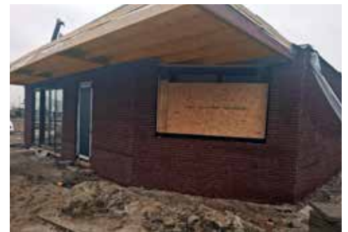
Clubhuis PCL in aanbouw

sultaat praat. "Vanaf mei hebben wij de mooiste polsstoklocatie van het land. Met een kantine én een eigen trainingsruimte. Dan kunnen we in de winter gewoon hier in Linschoten blijven trainen en hoeven we niet meer uit te wijken." De deadline is scherp: 9 mei. Dan staat de eerste wedstrijd op het programma en wil de club het gebouw feestelijk openen.