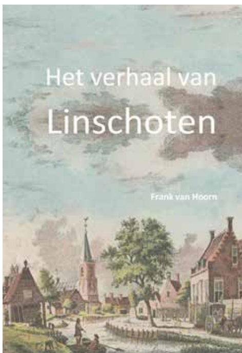
Omslag van Het verhaal van Linschoten

Het boek sluit af met een hoofdstuk 'Veel gestelde vragen' en de antwoorden op die vragen. Dat is een vriendelijke handreiking